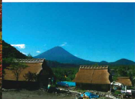
西湖いやしの里根場