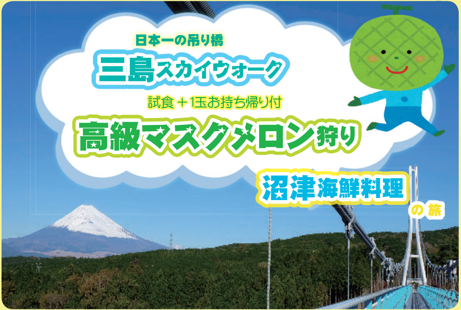
三島スカイウォーク