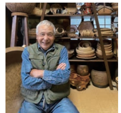
栗山さんから一言

「好奇心、探求心、負けず嫌い。この3つがあれば続けます。興味のある方は、是非一度ご連絡ください。」