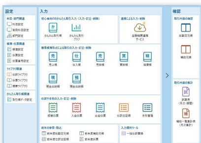
・メニュー（日常）画面

現金出納帳、預金出納帳、総勘定元帳などひとつひとつの画面がわかりやすい！ もちろん決算書・申告書の作成も可能で、印刷すればそのまま提出可能